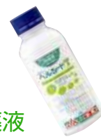
浸漬時の水量と使用薬液