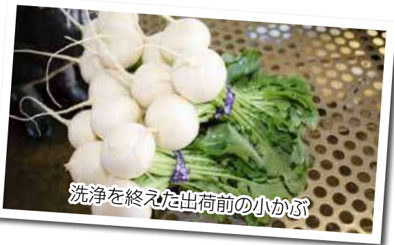
洗浄を終えた出荷前の小かぶ