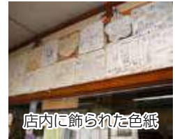
店内に飾られた色紙