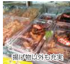
揚げ物以外にも充実