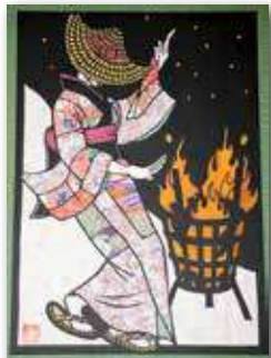
稔さんが作った切り絵です。当JA中根支店にも作品を展示させていただいております。